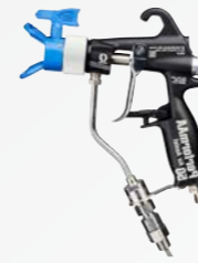
PerformAA™ 랙 건