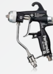
PerformAA™ 에어 어시스트 건