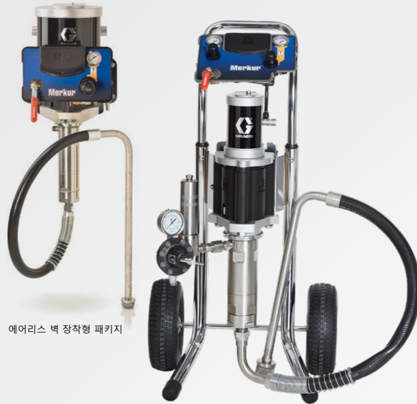
에어리스 벽 장착형 패키지

건이 포함된 모든 패키지에는 접지된 7.5m(25ft) 정전기 유체 및 에어 호스가 포함됩니다.