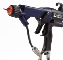
Pro XP™ AA 에어 어시스트 정전건