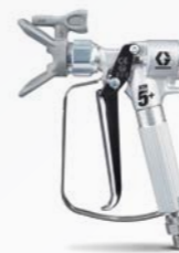
XTR5+™ 에어리스 건